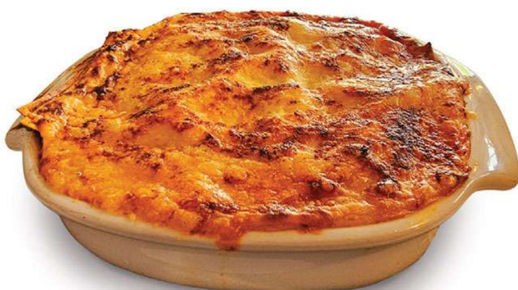
Lasagne alle Melinzane