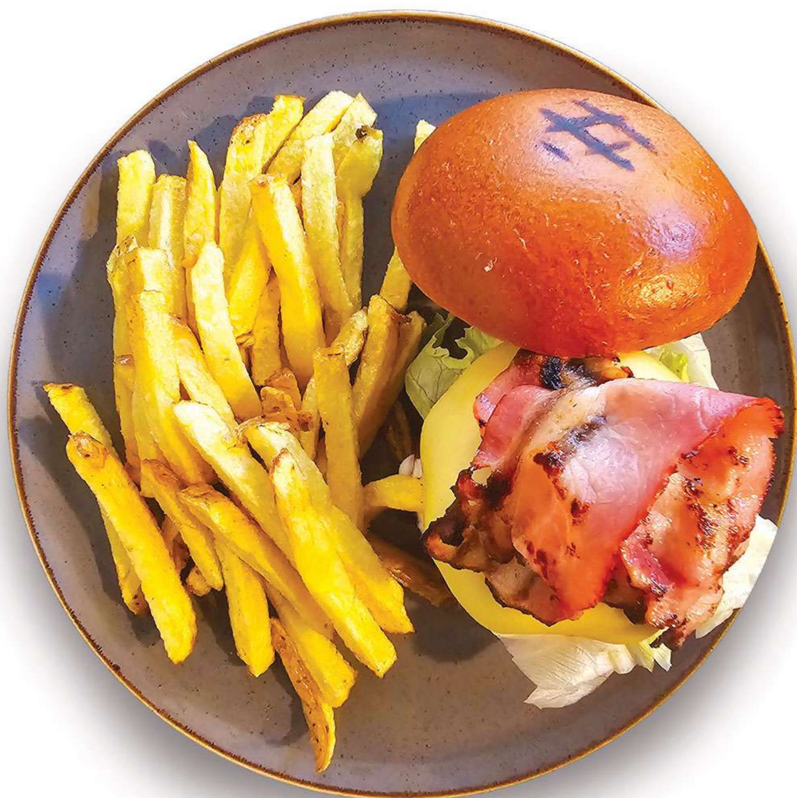
Pancetta e formaggio Burger

* Όλα συνοδεύονται με φρέσκιες πατάτες τηγαντές