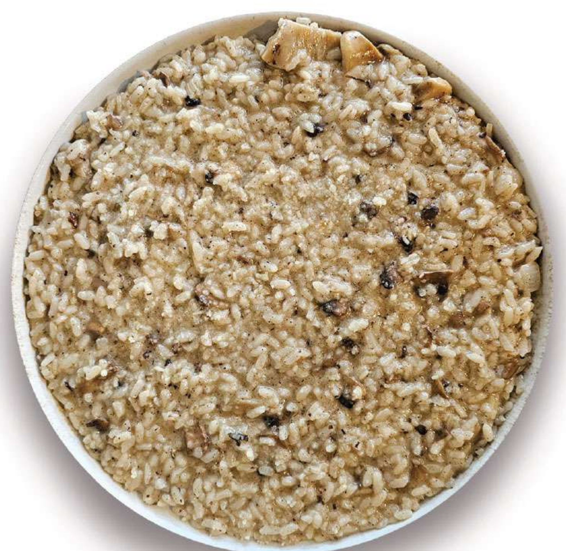
Risotto Funghi e Tartufo