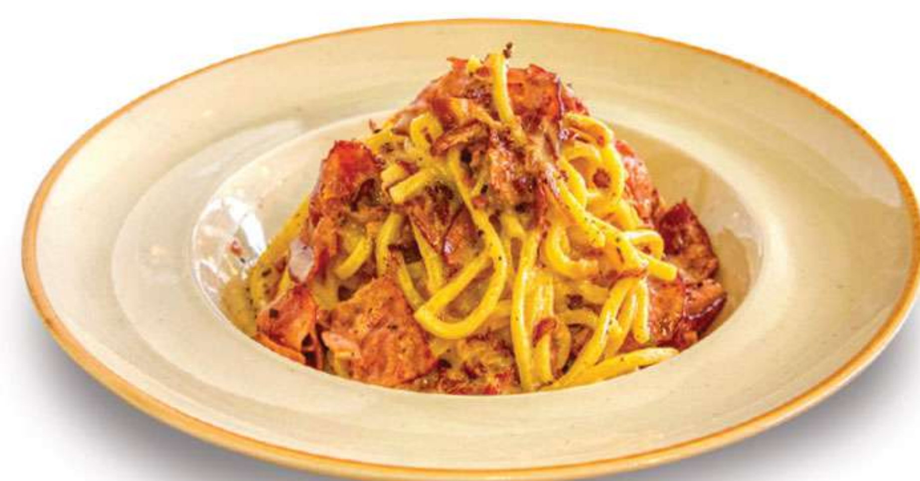
Carbonara con Guanciale