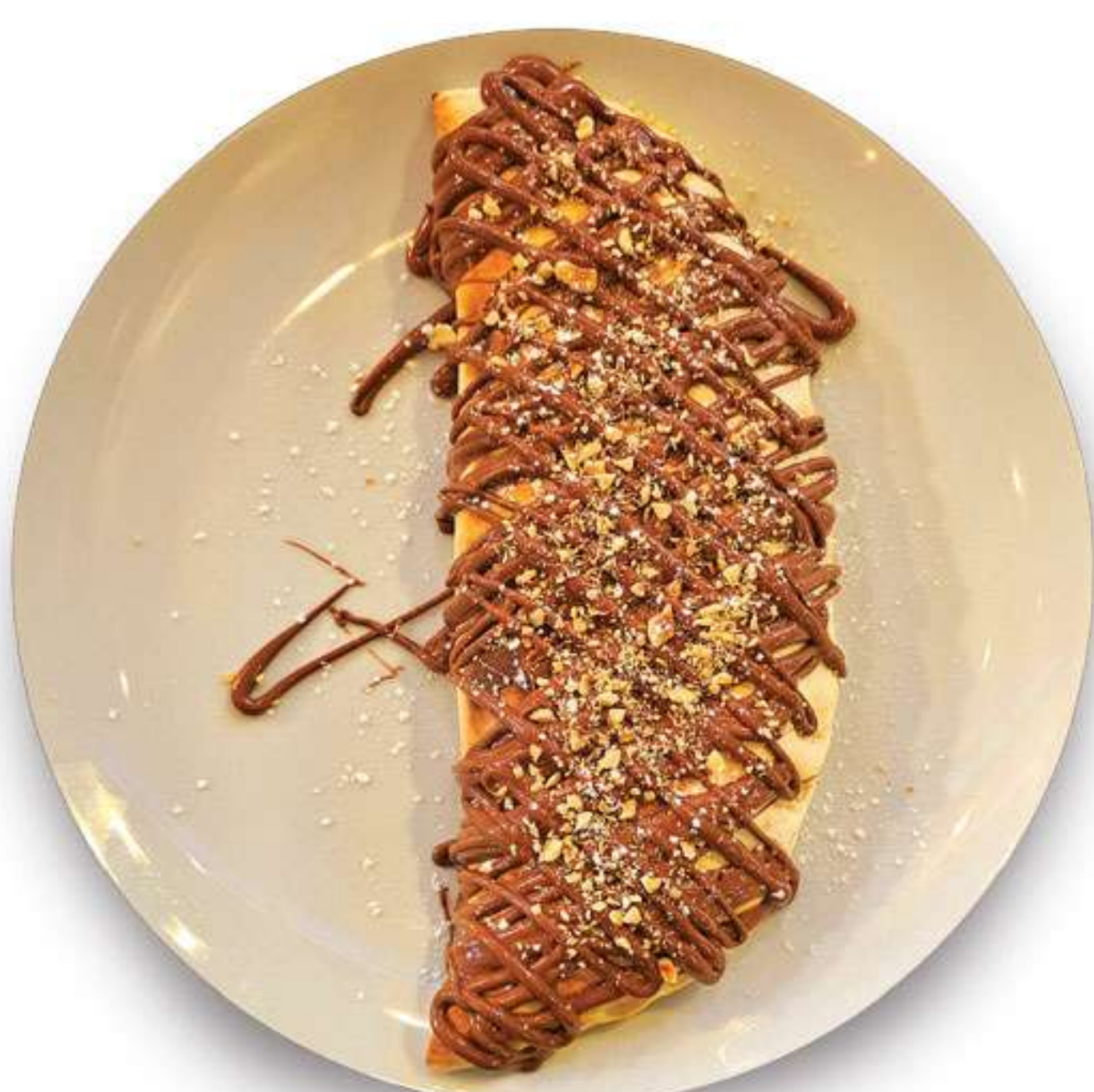
Mini sweet calzone